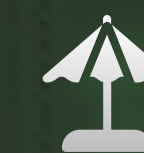
LA MER BEACH